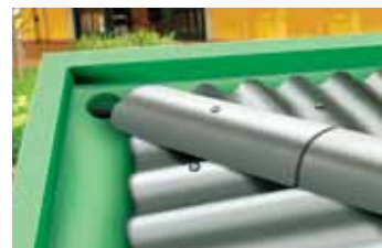
Calhas de concreto e alvenaria