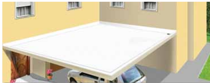
Lajes não transitáveis

Impermeabilização de lajes, coberturas e marquises não transitáveis, banheiros, cozinhas, calhas e estruturas em geral de concreto ou pré-moldadas, paredes de alvenaria, telhas cerâmicas, fibrocimento, metálicas, revestimentos cerâmicos, asfálticos, de madeira e outros.